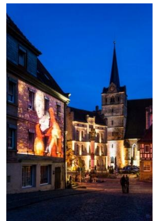
Fig. 2: Kronach Leuchtet 2015 - due esempi di installazioni e una video proiezione.